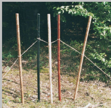
Ellen Hug Verbindungen